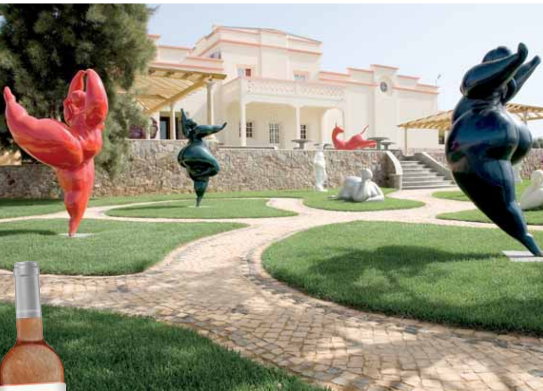
THE FRUITS OF LABOUR: VARIETIES OF WINE PRODUCED AT THE QUINTA. ABOVE: THE SCULPTURE GARDEN.

►► The Quinta dos Vales project has enabled him to realise his long held desire to return to art and making sculpture.