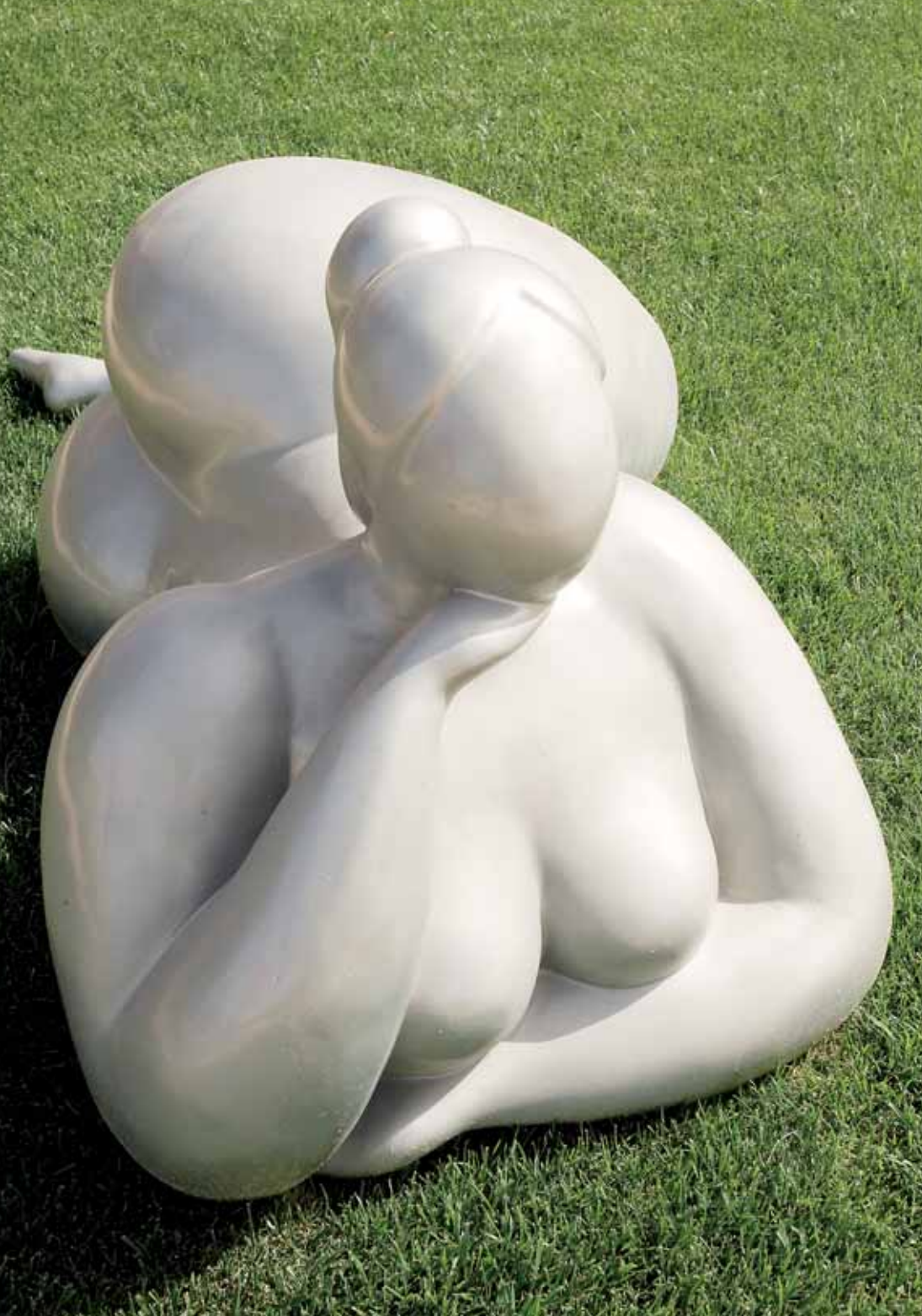
ABOVE AND BOTTOM RIGHT: VOLUPTUOUS FIBREGLASS NUDES.