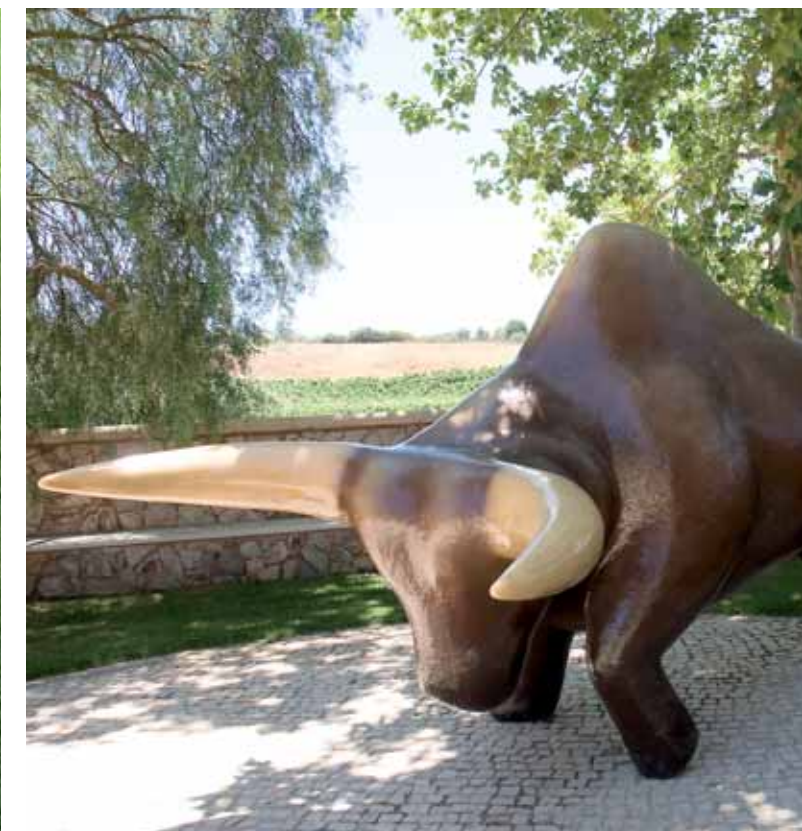
EXAMPLES OF ARTWORK FROM THE ESTATE'S SCULPTURE PARK.

►► The wine-making plant has been completely renewed and currently is producing around 70,000 litres of red and white a year.